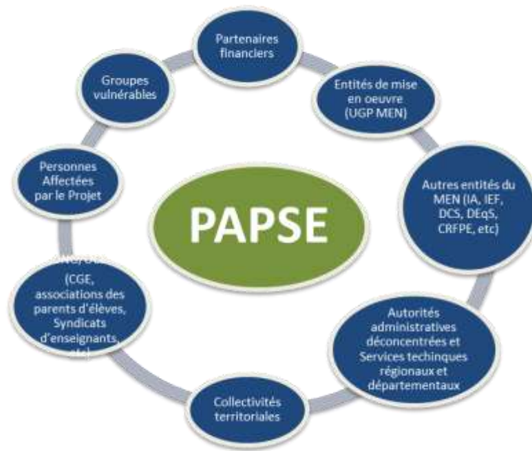
Figure 1 : Acteurs du PAPSE

Les sections ci-dessous détaillent les parties prenantes clés.